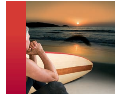
beginnendes Glaukom, mit leichtem Gesichtsfeldausfall

Das Auge ist das wertvollste Organ des Menschen. Über unsere Augen nehmen wir den größten Teil unserer Umwelt wahr. Ohne gesunde Augen hätten wir erhebliche Probleme, uns in unserer Umgebung sicher zu bewegen und zu orientieren.